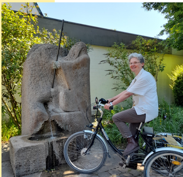
Natürlich nur für das Foto ohne Helm