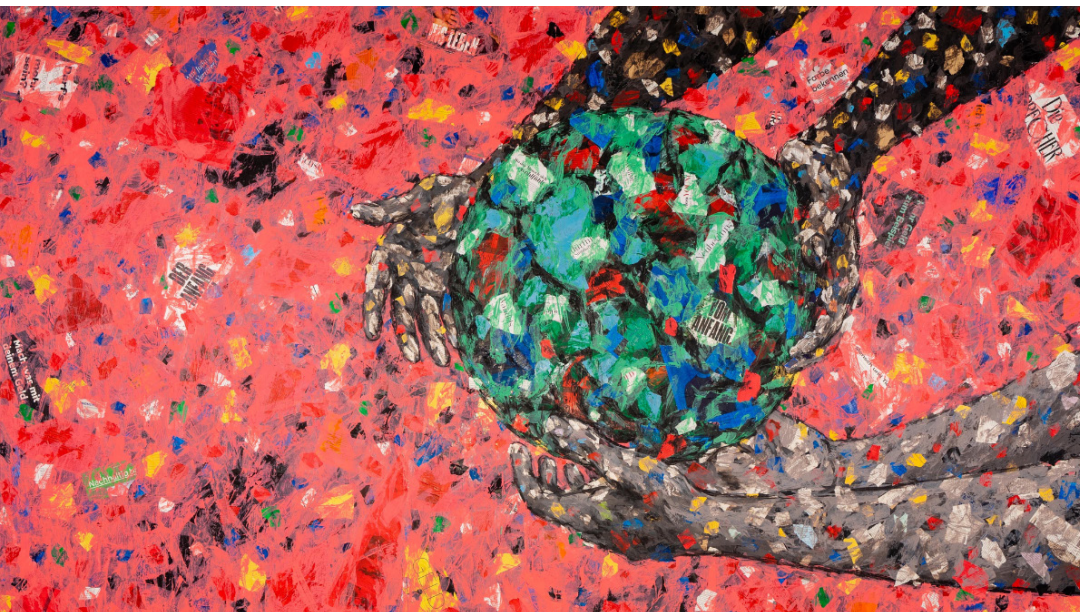
Das Hungertuch der Aktion Misereor fragt nach dem, was uns wichtig ist.

und fragt: Was tasten wir nicht an? Was ist uns das Leben wert? Was ist uns heilig? So ist das Hungertuch der Aktion Misereor Aufforderung zur Einmischung und Einladung, die Hoffnung auf ein neues, gerechtes Gesicht der Erde nicht aufzugeben. Wir haben es in der Hand.