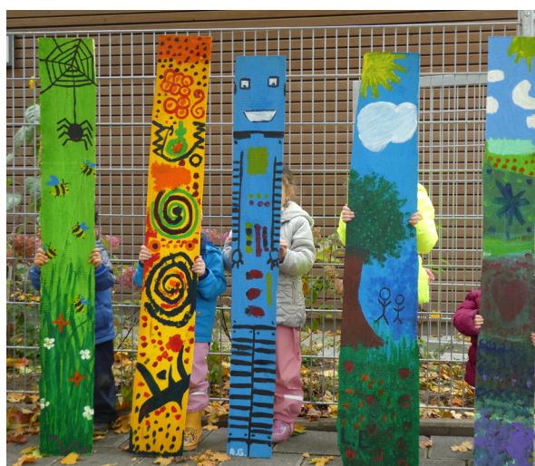
So wird der Zaun in Zukunft strahlen