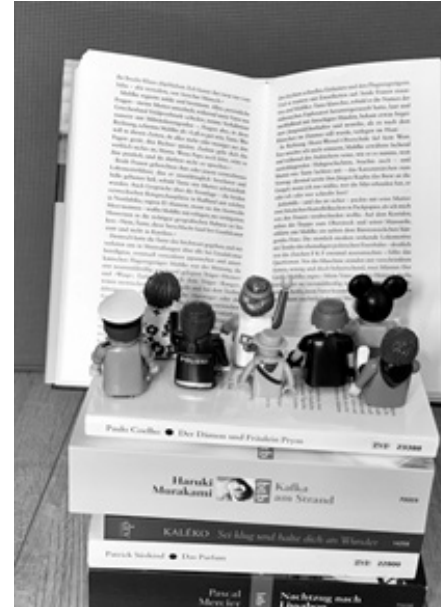
Wer wohl mit dabei sein wird?

Ist Ihr Interesse geweckt? Dann kommen Sie zum ersten Treffen am 15.11.22 um 20h ins Gemeindehaus (weitere Termine 20.12., 17.1.) und bringen Sie gerne eigene Vorschläge und Ideen mit! Bei Fragen bitte melden bei Claudia Dreßel