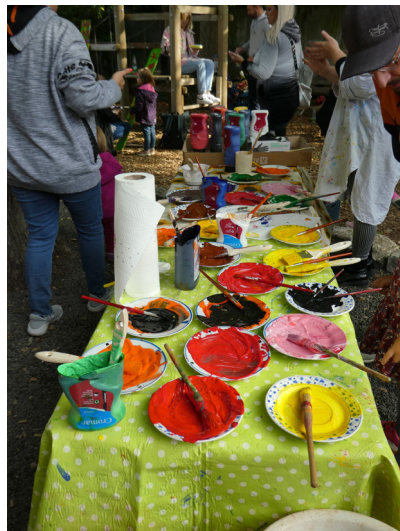
Diese Farbenpracht stand zur Auswahl

Emsiges Treiben herrscht im Garten der Kindertagesstätte. Kinder mit ihren Eltern beugen sich konzentriert über lange Holzschwarten und bemalen diese auf recht phantasievolle Weise. Da sind Dinos in unterschiedlichster Größe zu finden oder eine bunte und üppige Blumenwiese. Eine andere Familie hat sich für Linien und Formen entschieden. Das Team unterdessen eilt umher, um für ausreichend Farben und Holzschwarten zu sorgen. Zum Glück haben die Eltern genug Essen mitgebracht, denn so eine Aktion macht hungrig und ein Muffin oder ein Kuchenstück sind da sehr willkommen. Doch warum diese ganze Mühe? Der Zaun des Kindergartens soll mit den bemalten Stelen verschönt werden und schon von Weitem darauf hindeuten, dass hier ein Ort für Kinder ist.