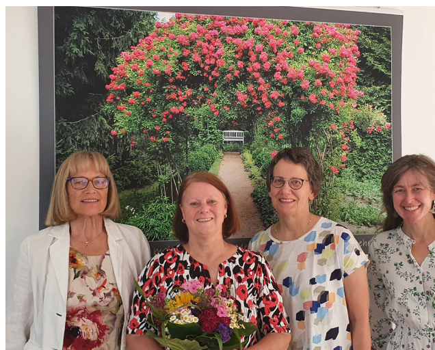
Danke an das engagierte Team

Und wie es weitergeht? Das ist noch nicht entschieden, doch hoffentlich werden bald wieder Bilder an den Wänden hängen.