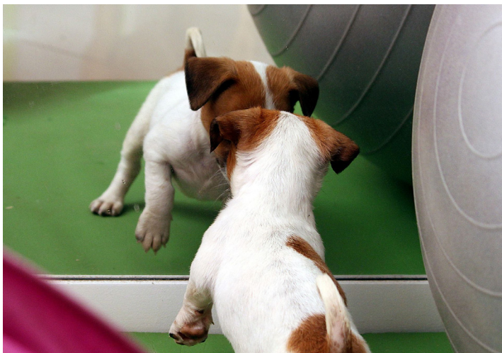
Wie ich hineinschaue, so schaut es hinaus

Einige Zeit später kam ein anderer Hund. Auch er betrat den Tempel. Als er in den Saal kam, sah auch er tausend andere Hunde. Er aber freute sich. Er wedelte mit dem Schwanz, sprang fröhlich hin und her und forderte die Hunde zum Spielen auf. Und er sah tausend Hunde, die ihm schwanzwedelnd entgegen sprangen. Dieser Hund verließ den Tempel mit der Überzeugung, dass die ganze Welt aus netten,