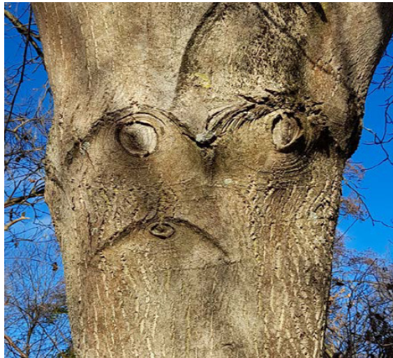
Ob auch ein Baum zornig sein kann?

Für ein Aussprechen unter guten Freunden