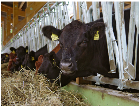
Glücklich oder nicht?

Die Themen Landwirtschaft, Nutztierhaltung und Umweltschutz sind in den Medien aktuell sehr präsent. In einer Vielzahl von Artikeln, Berichten und Reportagen versuchen Journalisten ei-